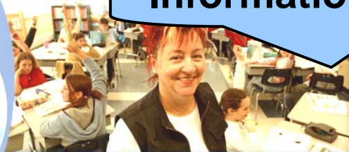
La vie professionnelle au coeur de nos préoccupations